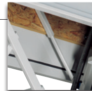
Lukenverkleidung aus hochwertigen OSB Werkstoff sowie einer verschweißten Vollgehrungszarge