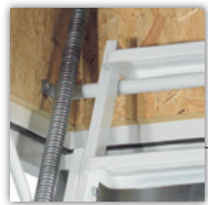
letzte Trittstufe im Lukenkasten, Treppen- paket ist fix am Rahmen montiert