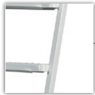
verzinkt - bzw. Pulverbeschichtete Ausführung