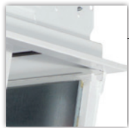
versenkt liegende Scharniere