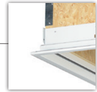
4 cm Rahmen - fix mit dem Lukenkasten verschweißt