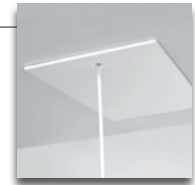
Unterdeckel umfasst den Treppenrahmen (fugenlose Untersicht)